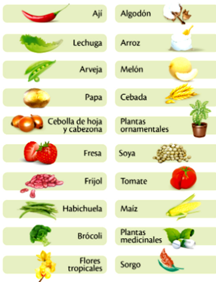
Figura 2. Cultivos de ciclo corto.