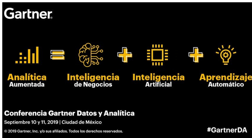
Fig. 3. Beats puede enviar datos directamente a Elasticsearch or via Logstash, donde puede seguir procesando y mejorando los datos, antes de visualizarlos en Kibana[3].

La analítica aumentada proporcionada por Elasticsearch ofrece insights valiosos que permiten entender mejor las necesidades y preferencias de los clientes. Esto permite adaptar los servicios y productos de manera más personalizada y proporcionar una experiencia de cliente mejorada y más satisfactoria.