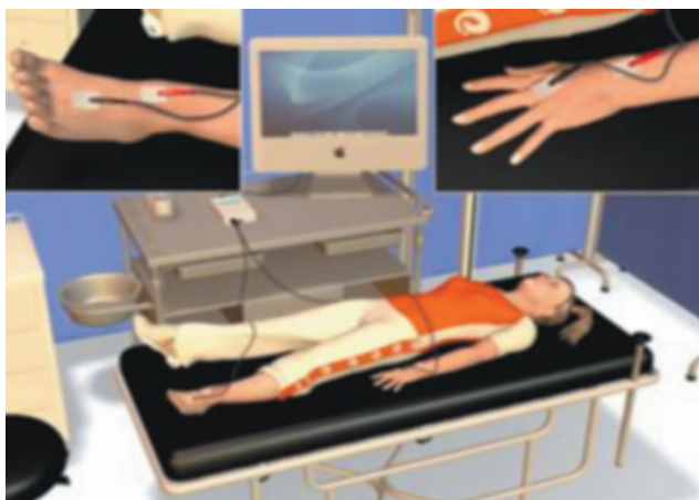
Fig. 3. Bioimpedancia.

Existen diversas técnicas para el análisis de impedancia bioeléctrica y la antropometría posee características similares en cuanto a accesibilidad y fácil manejo. Las comunes son mano-pie y tienen mayor precisión, es la más recomendada. La otra técnica, báscula de bioimpedancia es la más utilizada [5].