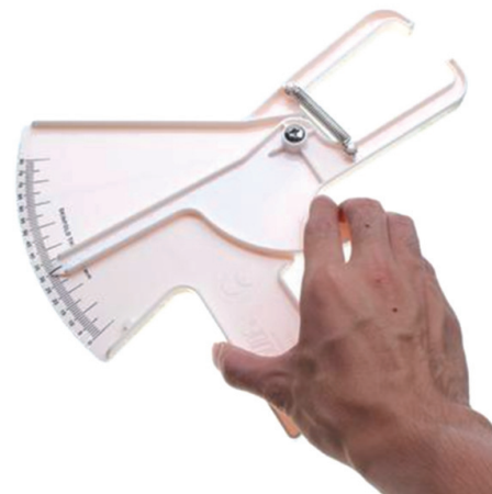
Fig. 4. Calibrador de pliegues.

El instrumento que se utiliza para medir los pliegues es el calibrador de panículo adiposo subcutáneo, la medida se toma en mm. (ver Fig. 4). Esto incluye una capa doble de piel y el tejido adiposo subyacente. El pliegue debe cogerse entre los dos índices y el pulgar y debe ser lo suficientemente grande como para que incluya una capa doble completa. La lectura se debe realizar unos dos segundos después de la aplicación del calibrador, cuando la aguja se detenga [8].