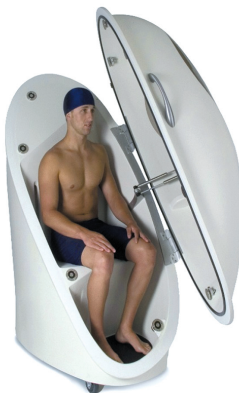
Fig. 2. Pletismografía.