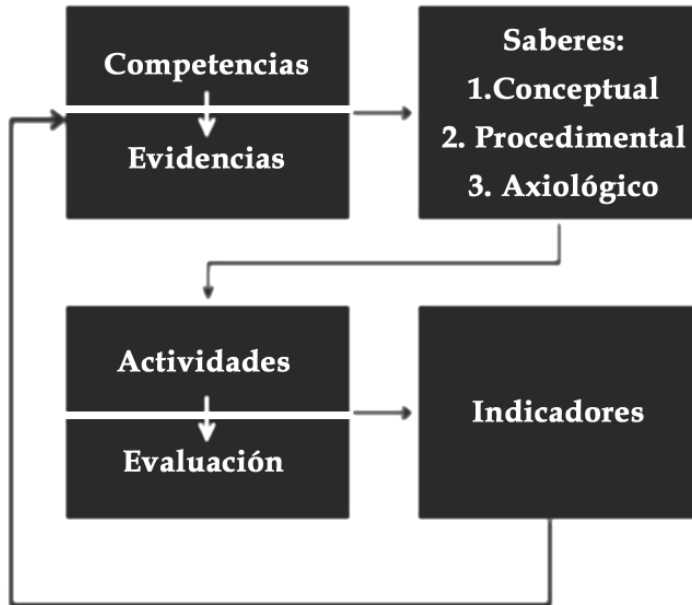
Figura 4. Definición de competencias.