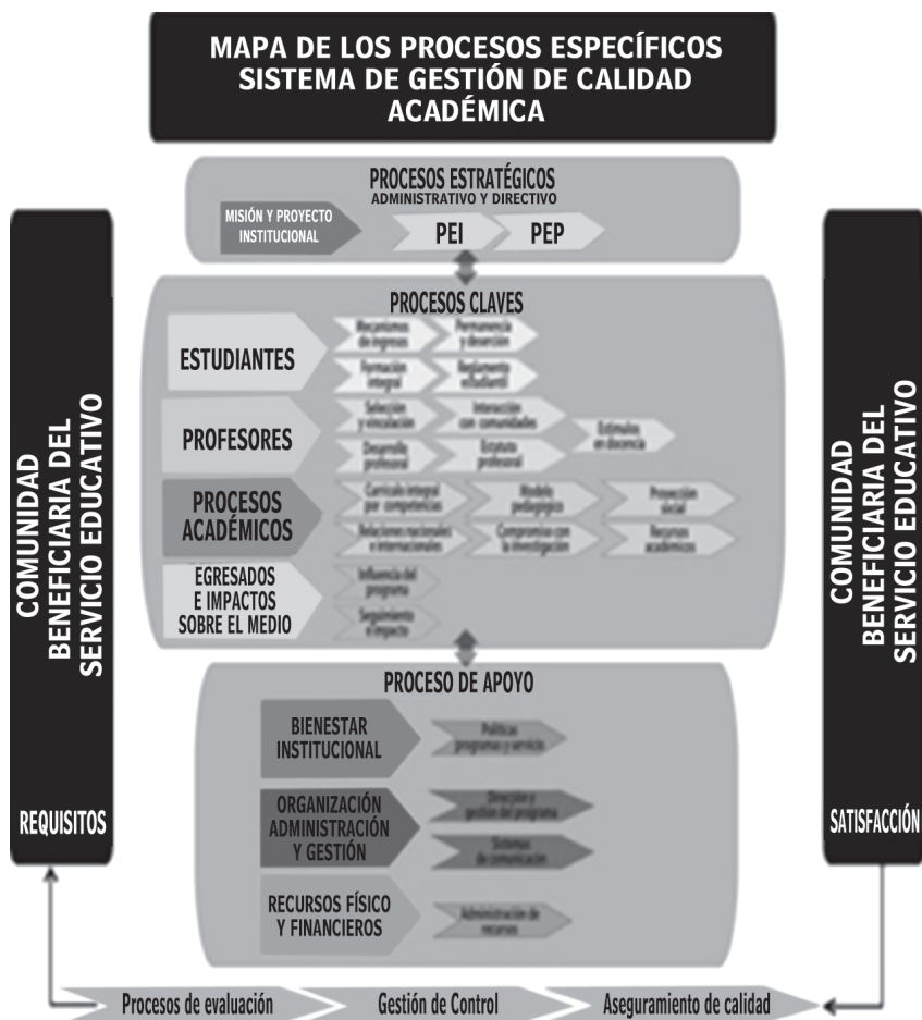
Figura 3. Mapa de procesos específicos.

procesos específicos, reconociendo la transversalidad de cada proceso específico con todo el Sistema de Gestión de Calidad Académica.