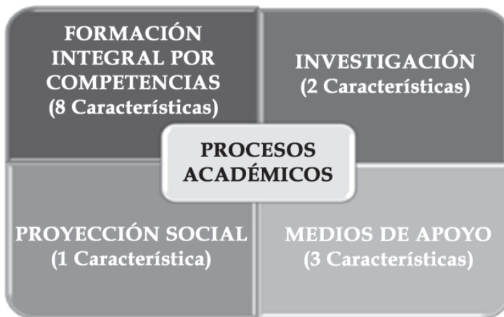
Figura 2. Categorización de los procesos académicos.